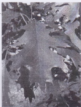
б) Дуб красный