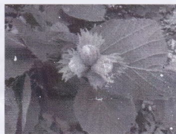
е) Орешник (лещина)