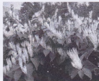
в) Гречиха сахалинская