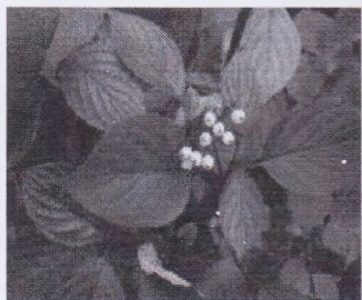
а) Свидина кроваво- красная