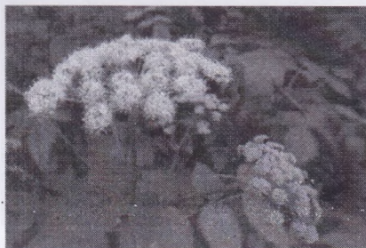
г) Дудник лесной