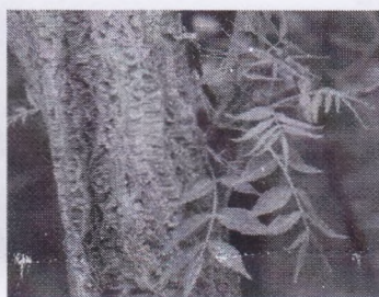
д) Бархат амурский