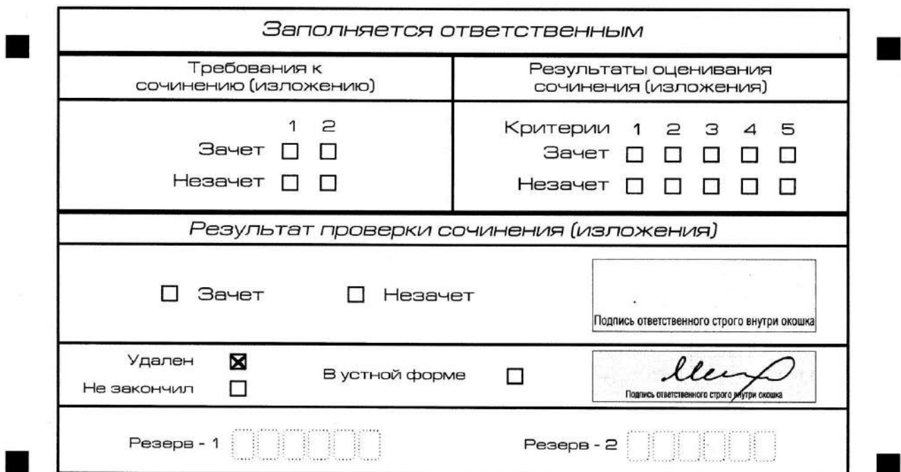
Рис. 13. Заполнение полей нижней части бланка регистрации (удаление с экзамена)

В случае если участник итогового сочинения (изложения) нарушил установленные требования, изложенные в пункте 27 Порядка проведения государственной итоговой аттестации по образовательным программам среднего общего образования (приказ Министерства просвещения Российской Федерации и Федеральной службы по надзору в сфере образования и науки от 07.11.2018 г. №190/1512), он удаляется с итогового сочинения (изложения). Член комиссии по проведению итогового сочинения (изложения) составляет «Акт об удалении участника итогового сочинения (изложения)» (форма ИС-09), вносит соответствующую отметку в форму ИС-05 «Ведомость проведения итогового сочинения (изложения) в учебном кабинете ОО (месте проведения)» (участник итогового сочинения (изложения) должен поставить свою подпись в указанной форме). В бланке регистрации указанного участника итогового сочинения (изложения) необходимо внести отметку «X» в поле «Удален». Внесение отметки в поле «Удален» подтверждается подписью члена комиссии по проведению итогового сочинения (изложения) (см. рис. 13).